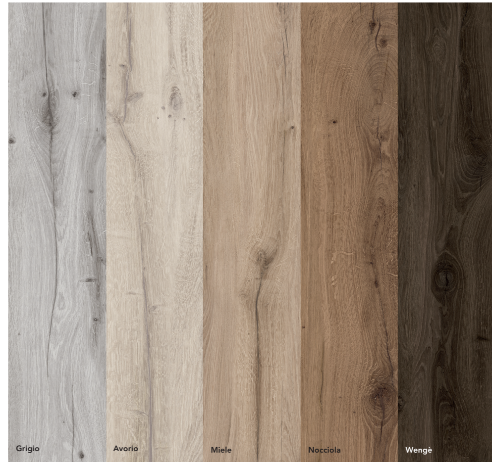
Grigio Avorio Miele Nocciola Wengè